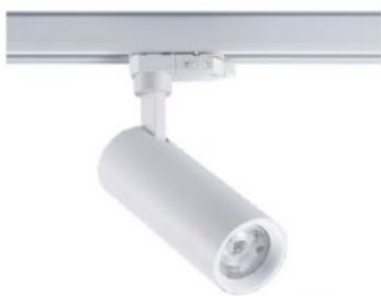
Schienenstrahler BINOR 3 Gehäuse