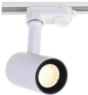
Schienenstrahler BINOR 2 S Gehäuse kurz