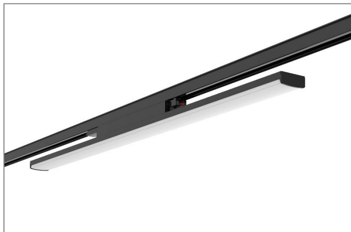
LUX Linea 3 Track