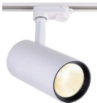
Schienenstrahler BINOR 2 XL Gehäuse lang