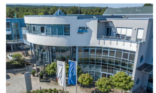
POLYRACK Hauptsitz in Straubenhardt, DE