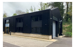
Verotec Hauptsitz in Hampshire, UK